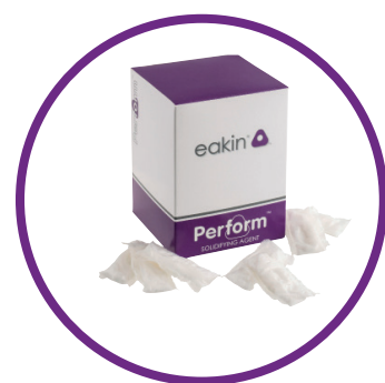
Perform™パフォーム ジェル (凝固剤)